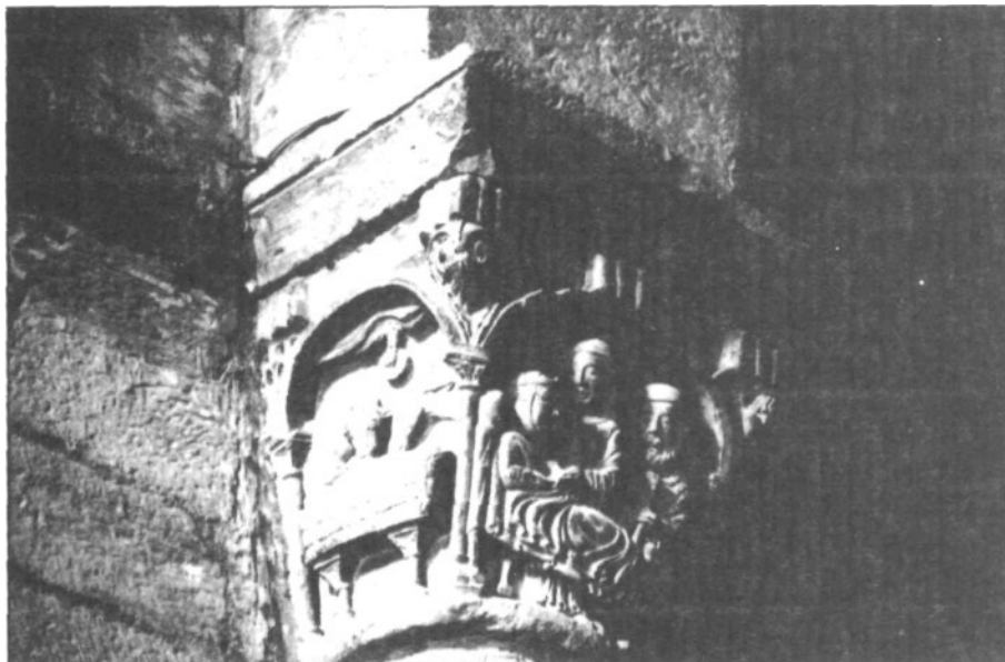
Iglesia de la Magdalena - Tudela (Navarra). Capitel muro Norte.