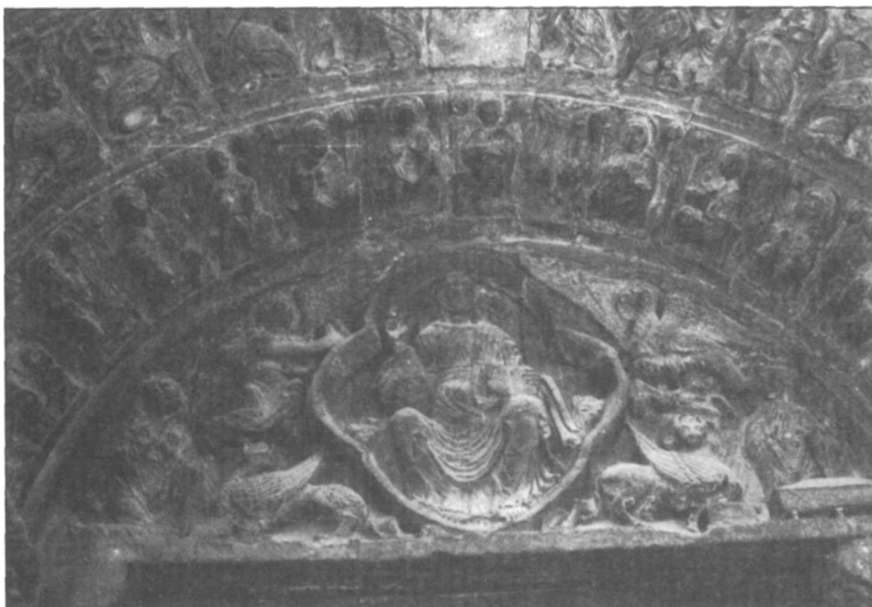
Iglesia de la Magdalena - Tudela (Navarra). Tímpano y arquivoltas de la Puerta Oeste.

La Puerta Oeste presenta particularidades estilísticas que la diferencian del resto de la escultura de esta Iglesia. Las figuras son menos elegantes y finas que en el interior, un poco regordetas, o al menos, achaparradas y de realización más tosca. Por ello muchas veces la inserción de los miembros