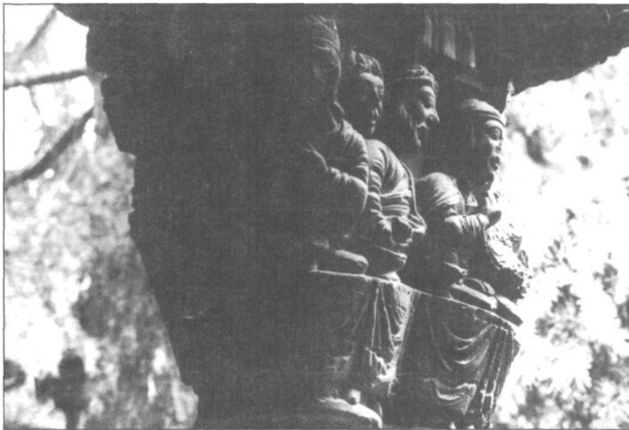
Iglesia de la Magdalena de Tudela (Navarra). Claustro Ala Norte capitel 5. Bodas de Caná (cara Oeste y Norte).

Como conclusión podemos hablar de la existencia de un primer taller escultórico -para la Magdalena- que realizó los capiteles del interior de la nave y los de la puerta Norte y que estuvo conectado con la primera fase o ala Norte del Claustro de la Catedral tudelana. El segundo taller -autor de la Puerta Oeste- debió ser el mismo que el del interior pero evolucionado y con nuevos escultores que se sumaron a los ya existentes. Todos ellos siguieron una nueva orientación determinada por el nuevo taller -también evolucionado- del claustro, que trabajaba en la parte última del ala Este. El segundo taller de la Magdalena está además influido por el tímpano de San Nicolás de Tudela. Finalmente a estos dos talleres iniciales hay que añadir los tres diferentes que realizaron los canecillos de cada uno de los aleros (Norte, Sur y Oeste) de la Iglesia. Respecto a éstos, si el taller del alero Norte pudo estar conectado con el del alero Sur, no podemos decir lo mismo del taller que realizó los Oficios del alero Oeste, el cual es diferente a todo lo de Tudela y relacionado en todo caso con algunas figuras de Santa María de Sangüesa. Así pues, quedan suficientemente delimitados los diversos talleres que realizaron la escultura de la Iglesia de Santa María Magdalena y su relación con el resto de las obras contemporáneas de Tudela. Por otro lado, queda patente la