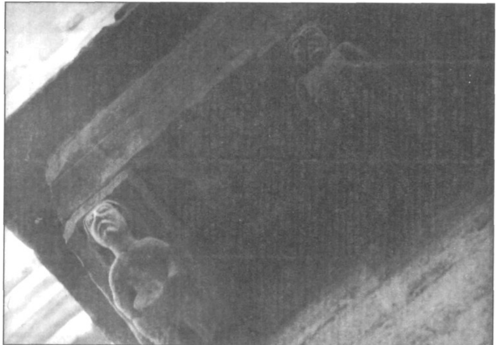
Iglesia de la Magdalena - Tudela (Navarra). Canecillos Alero Oeste.