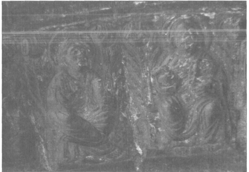
Iglesia de la Magdalena - Tudela (Navarra). Primeras archivoltas de la Puerta Oeste.