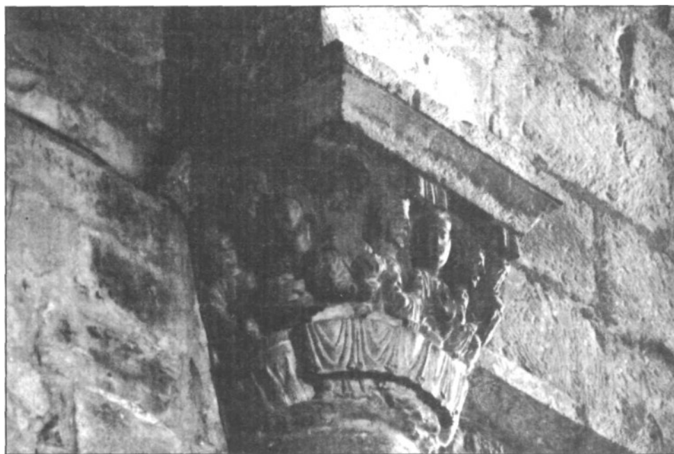
Iglesia de la Magdalena - Tudela (Navarra). Capitel muro Sur.

interior y la Puerta Norte, vemos que es en el claustro de la Catedral de Tudela -concretamente en las alas Norte y primera parte de la Este- donde se encuentra un tipo de escultura muy similar. Los caracteres generales de estilo en ambos conjuntos son los mismos si bien -como veremos- pue-